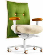
BRASILIAN CHAIR KN 97